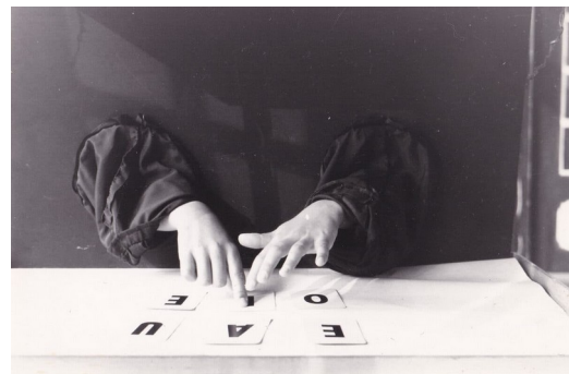
Dermo-optische Experiment

. Wenn wir diese Protokolle in Improvisationsprotokolle übersetzen, behalten wir ihre Hauptmerkmale bei: Alle Protokolle werden unter Hemmung von mindestens einem oder mehreren Sinnen praktiziert. Mit geschlossenen Augen, mit geräuschkämpfenden Kopfhörern, ohne Körperkontakt oder sogar isoliert in getrennten Räumen entdecken die Performer:innen ein neues Bewegungsrepertoire und neue Arten der Beziehung zu anderen Menschen und zur Umwelt.