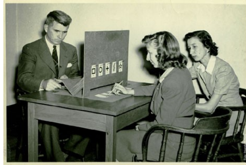
Metapsychisches Protokoll mit den ESP-Karten (für Extrasensory Perceptions)

. Ich bin von dieser Zahl besessen: ich habe mein vorheriges Projekt Le triangle d'incertitude genannt, in Anlehnung an eine Technik zur maritimen Geolokalisierung anhand von drei Punkten in einer Landschaft. In ihrer Studie über zeitgenössische Hexerei hat Jeanne Favret-Saada ein System von Plätzen identifiziert, die mehr oder weniger austauschbar sind: Verkünder:in, Verhexte, Enthexer:in. Auch die wissenschaftlichen Protokolle des Internationalen Metapsychischen Instituts beinhalten oft drei Rollen : Experimentator:in, Versuchsperson(en) und Prüfer:in.