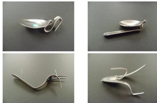
Photo-Auszug vom "Metapsychique 1", Dossier über die Psychokinese (2017)